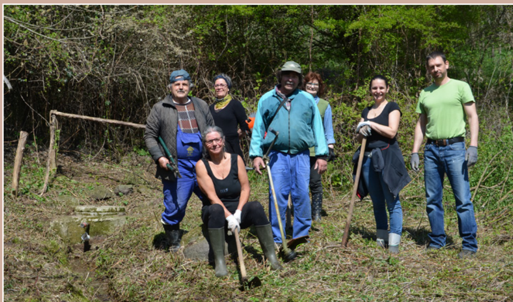
A falutakarítási akció keretében a Foxódi forrásnál

Ünnepén is, ahol megint nagy sikere volt a megszokott nőegyletes tócsinak. A ravatalozóra, a keresztek környékére és a faluban az eddig gondozott virágokra idén is odafigyeltünk. November 27-én pedig ismét felállítottuk a Betlehemet, illetve részt veszünk a gyertyagyújtásokon, melyek közül az utolsóra rövid műsorral és finom süteményekkel is készülünk.