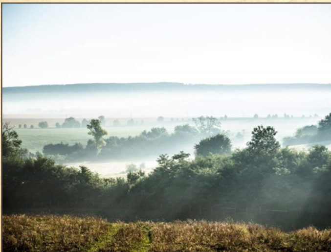
A dörögdi táj

A Dörögdi Mező Kft. lassan 3 évtizede meghatározó környezetformáló szerepet tölt be Taliándörögdi életében. A települést körbevevő lankás dombok műveltsége, a természeti környezet szépsége a családi vállalkozás tájformáló, tájfenntartó tevékenységének is köszönhető. A cég hírneve nem csak országszerte, de az országhatárokon túl is ismert. A tenyésztői versenyeken évről-évre újabb díjakat elhozó, messze földön híres állatok és gazdáik méltán emelik településünk hírnevét. A szerteágazó tevékenységi körnek köszönhetően a vállalkozás igencsak sokszínű, ami az ezt fenntartók keze munkáját is kiemelten dicséri.