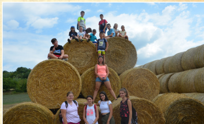
Nyári tábor a Községi Házban

tuk a szokásos Márton-napi libavacsorát, de az Idősek napját sajnos jobbnak láttuk lemondani az erősödő vírushelyzet miatt. A megszokott ünnepélyes, műsoros est helyett - a tavalyi sémához visszatérve - otthonaikba eljuttatott csomagokkal kedveskedtünk az időseknek, ami tele volt minden jóval: narancssal, mandarinnal, fügével, datolyával, földimogyoróval, no meg csillogó dióval és