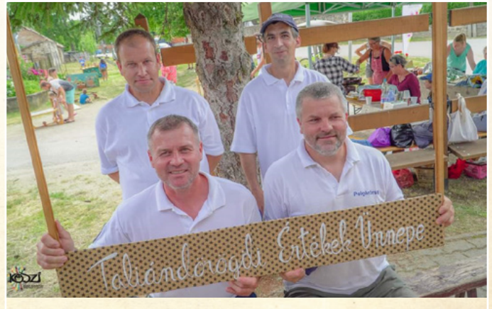
Szolgálatban a falu rendezvényein

Az év folyamán a Taliándörögdi Polgárőr Egyesület több rendezvény biztosításában is részt vett, többek között ilyen volt a Balaton-felvidéket átszelő Tour de Hongrie kerékpáros verseny is, mely hatalmas élmény volt a szolgálatot teljesítő polgárőrök számára. Ezen kívül helyi rendezvényeken is jelen voltak, a májusi Fogathajtó versenyen, az Értékek Ünnepe és a szeptemberi Elszármazottak Találkozóján is. A Szüreti felvonulás felvezetésében