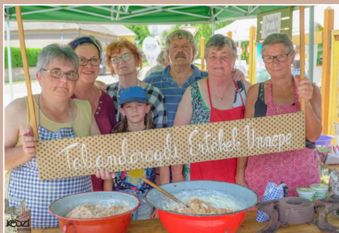
Készül a töcsi az Értékek Ünnepe

Később részt vettünk a Taliándörögdi Értékek