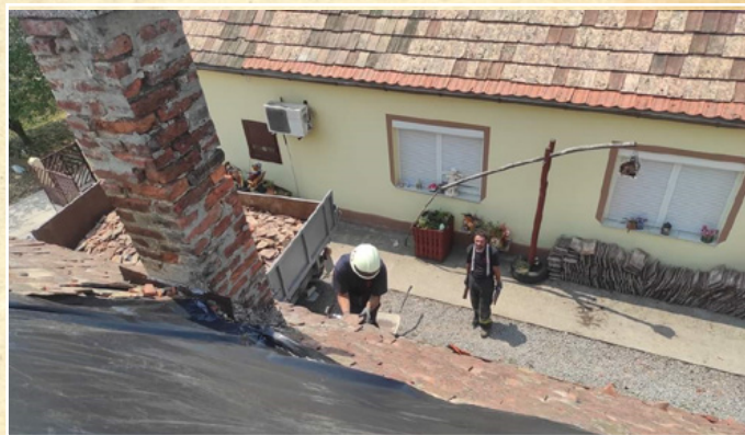
Tetőzés Sellyén a viharkárok után

A tavalyi évvel ellentétben idén kevés riasztás érkezett az önkéntes tűzoltókhoz, csupán egy bálutúzhöz vonultak ki a nyár végén, mely nem igényelt különösebb figyelmet.