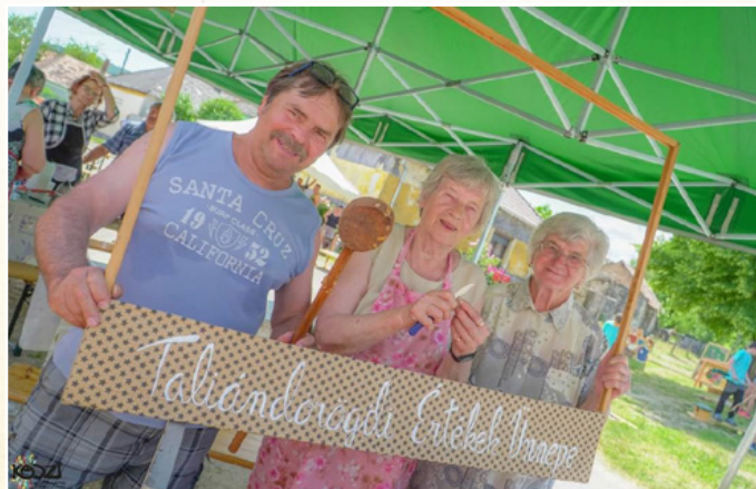
Főzőcskézés az Értékek Ünnepe

is. Ezek után az Értékek Ünnepe is bemutatták felülmúlhatatlan főzőtudásukat a „legtapasztaltabbak”, az ilyenkor tőlük megszokott minőségben csülök pörkölttel színesítették a kínálatot. A nyári szünet után Padragkúton vendégeskedett a csapat a „Jó szerencsét” Nyugdíjas Klubnál, melynek keretében megünnepelték az aktuális névnapokat. Az őszi programok során is mindig számíthatott a falu a Nyugdíjas Klub háttér munkájára. Az Elszármazottak találkozójára helyszínt biztosítottak és az előkészületekben is szerepet vállaltak, majd később a Nagy konyhájának is teret és eszközt