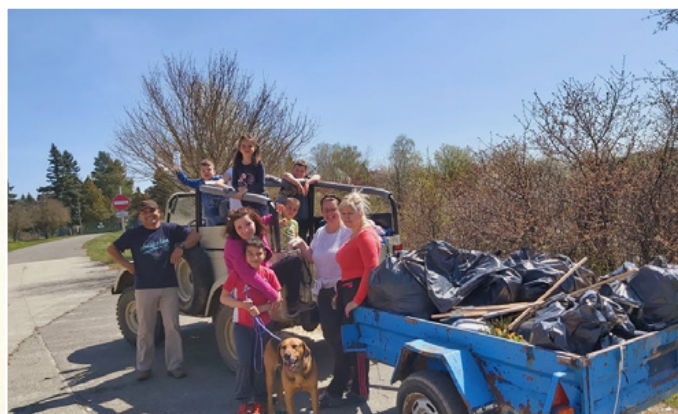
Tavaszi szemétszedési akció