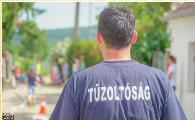
Tűzoltó verseny az Értékek Ünnepe