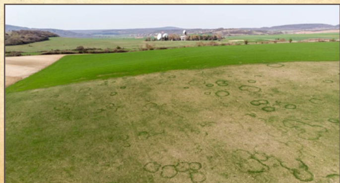
Űrtávközlési Földi Állomás – Szputnyik