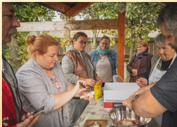
Közös munka a kemencénél