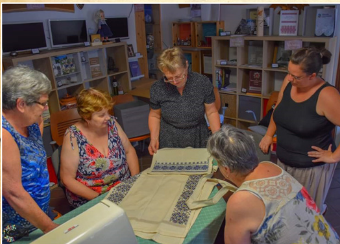
Hímzőkör munka közben

2021.06.19-én valósult meg a Taliándörögdi Értékek Ünnepe, a tervezettek szerint.