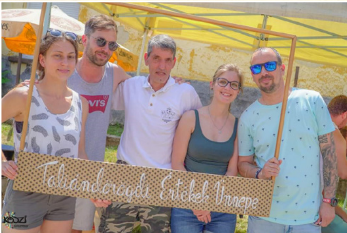
Főzés az Értékek Ünnepe