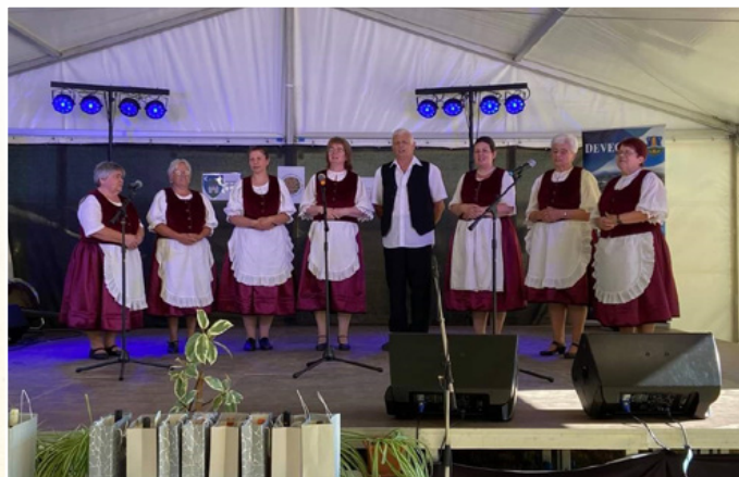
Vendégek voltunk a Bakony-Somló Népművészeti Találkozón