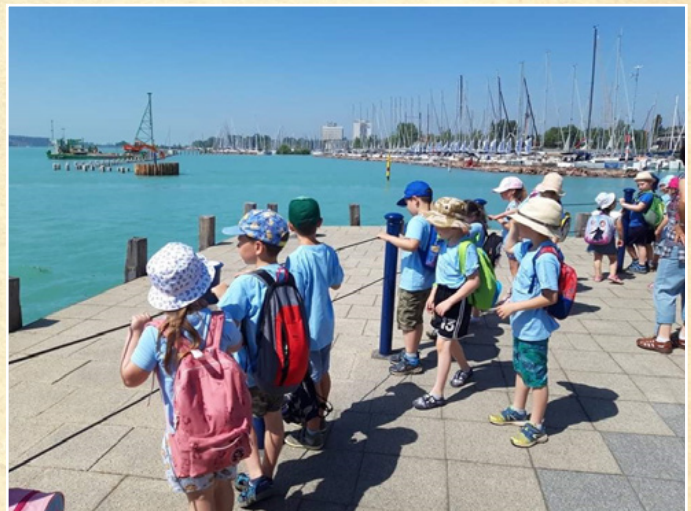
A Balaton varázsa