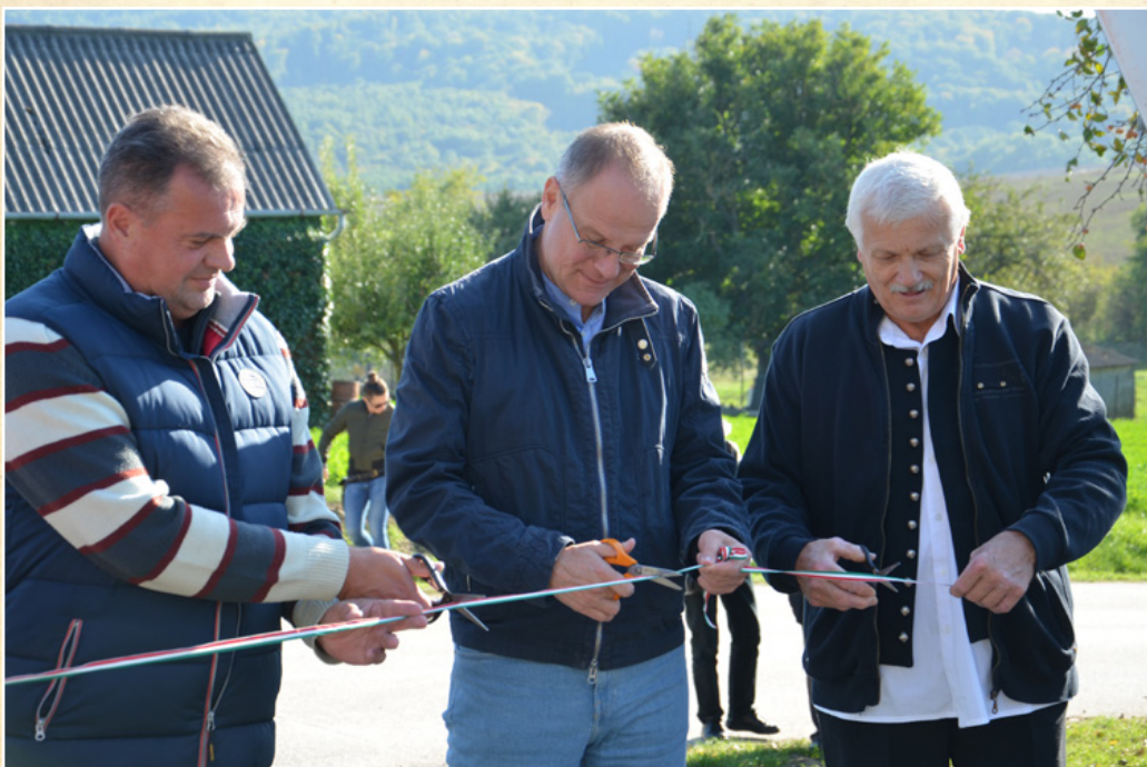
Új útszakasz átadás

megújult 2.980.000 Ft-ból, a Magyar Falu Program keretein belül. A Béke, a Tavasz és a Palotakúti utca aszfaltburkolatán felújítása is megtörtént, a Toldi és a Rákóczi utca kátyúzása mellett 19 millió forintból, melyhez 16 millió forint belügyminisztériumi támogatást kaptunk.