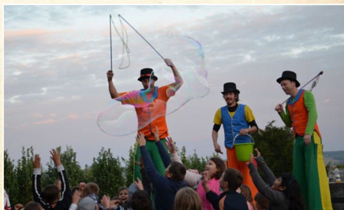
Gólyalábasok a Szüreti felvonuláson