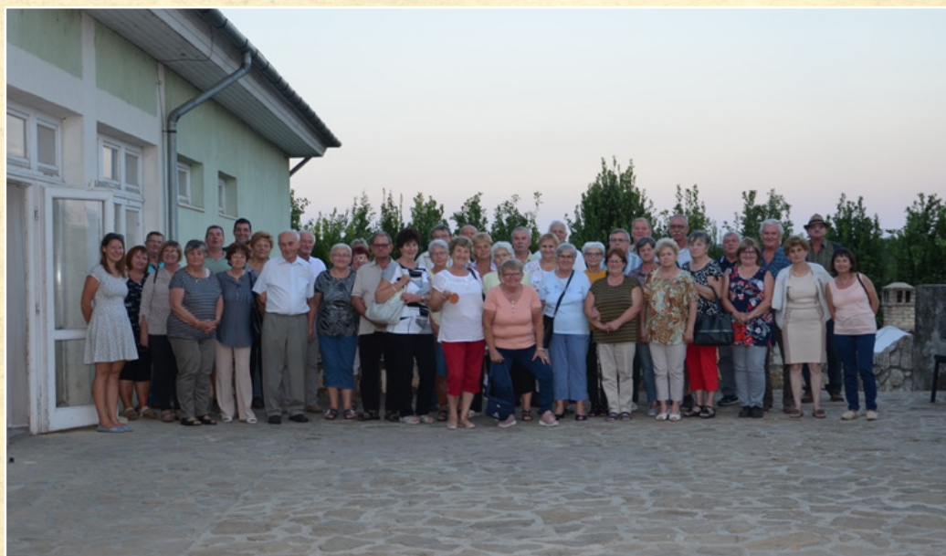
Elszármazottak találkozója Taliándörögdon

Az év első felében már nagyon vártuk a nyitást. Kiseb közösségi akciók voltak ugyan, de a klasszikus értelemben 2020 novemberétől a következő májusig nem találkozhattunk programokon, közösségi megmozdulásokon. Azért egy kicsi csaltunk, és áprilisban szemétszedési akciót szerveztünk, kisebb családi-baráti csoportokban gyűjtöttük zsákokba a szemetet a falu határában – közel 50 fővel. A gyermeknap még hasonlóképpen zajlott, szintén egyénileg és kisebb csoportokban vágtak neki a gyerekek a közeli erdőknek és mezőknek. A játék során különböző jeleket kerestek és logikai, humoros feladványokat oldottak meg, melyek eredményeként a sikeres teljesítők a titkos jelszót megmondva ajándékot kaphattak, melyet 38 gyermek ki is érdemelt.