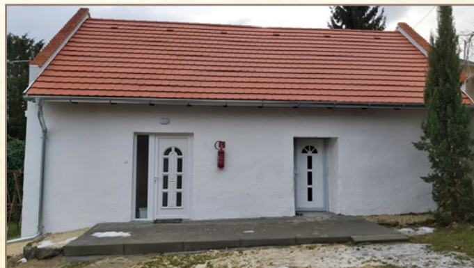
A felújított épületrész