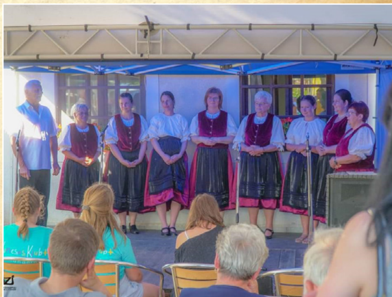
Fellépés a Taliándörögdi Értékek Ünnepe

lai Falunapon és a deveseri Bakony-Somló Népművészeti Találkozón is. Az őszi szintén egy helyi fellépéssel indítottuk: részt vettünk az I. Taliándörögdi Elszármazottak találkozásánál egy Dörögdi és egy Arató csokorral. Október 18-án szintén Taliándörögdon a Közösségi Házban az a megtiszteltetés ért bennünket, hogy a Nemzeti Művelődési Intézet által szervezett „Látópont” című ünnepélyes átadó rendezvényén köszönthettük a díjazásban részesülő szervezeteket – köztük nagy örömminkre saját településükről a KÖSZI-t is.