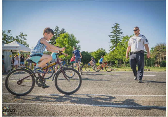
Közlekedésbiztonsági pálya felavatása

2021.08.16-án és 17-én valósult meg a fiatalok jutalomkirándulása és látóútja, melyen első nap a kislódi Kalandparkba mentek közösségerősítő programokra, majd másnap a nagyvázso-