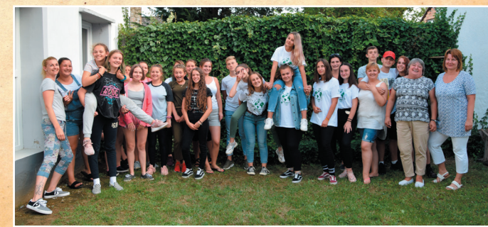
Határtalanul az Értékekörök Birodalmában tábor

Új értékör program indítására is lehetőségünk volt. 2019 őszén ezt Baranya megyében tettük, Szigetváron. Olyan fiatalokkal találkoztunk, akik az ottani Várbaráti Kör ifjúsági tagozatában már tevékenykedtek, komoly helytörténeti ismeretekkel rendelkeztek, és olyan felnőtt segítőkkel, akiknek a munkássága kiváló példa a fiatalok előtt. Két hétvégét tudtunk velük együtt tölteni, melyek során megismerték az értékör programban alkalmazott módszereket, és volt alkalom a gyakorlatban is kipróbálni azokat. A Szigetvári Várbaráti Kör tevékenysége bennünket is lenyűgözött, mi is sokat tanultunk a program során.