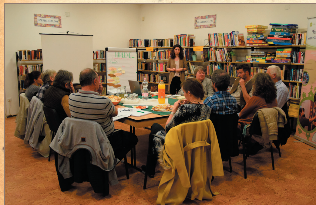
A Szemléletformáló Munkacsoport találkozója

lakosságának száma, január 1-i adat szerint 665-en vagyunk. Az önkormányzat saját bevételeit tekintve a Községi Ház termeinek béreltetéséből 346.000 Ft; irodabérletből, lakbérből és a Művészetek Völgyétől kapott támogatásból 1.572.000 Ft; a Dörögdi Durmoló szállásdíjából 6.415.000 Ft, míg a közhatalmi bevételekből – adókból – 13.000.000 Ft bevétel származott, ami összesen 21.333.000 Ft-ot jelent.