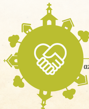
Taliándörögd, az EGYÜTTMŰKÖDŐ település

2017. szeptember 15-én nyújtotta be a KÖSZI konzorciumi partnerségben Taliándörögd Község Önkormányzatával az „Észrevesszük, szavá tesszük, megoldjuk! - Taliándörögd, az EGYÜTTMŰKÖDŐ település” című pályázatot. A döntés 2018. augusztusában született meg, ekkor kaptuk a hírt, hogy nyertünk. Nagyon örültünk neki, de tudtuk azt is, hogy nagyon nagy feladat áll előttünk.