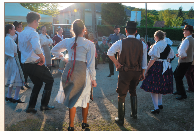
Táncház a III. Taliándörögdi Értékek Ünnepe