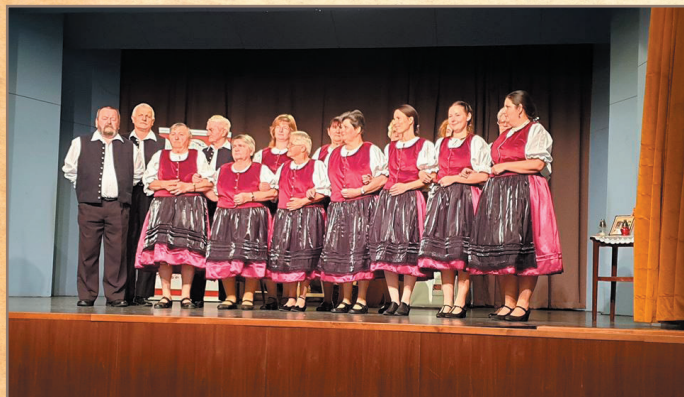
Vass Lajos Népzenei Verseny

A Taliándörögdi Népdalkör tartalmas esztendő tudhat maga mögött. Ez amolyan HÍD – ÉV. Átívelt a múltból, és tovább mutat a jövőbe. Nézzük hát részletesen honnan hova ívelt ez a híd, és hová tart?