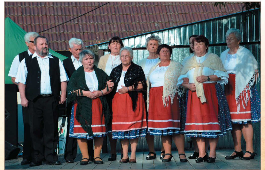
Fellépés az Értékek Ünnepe

Kapcsolódjon be a Taliándörögdi Népdalkör színes és tartalmas életébe! Mindenkit szívesen látunk!