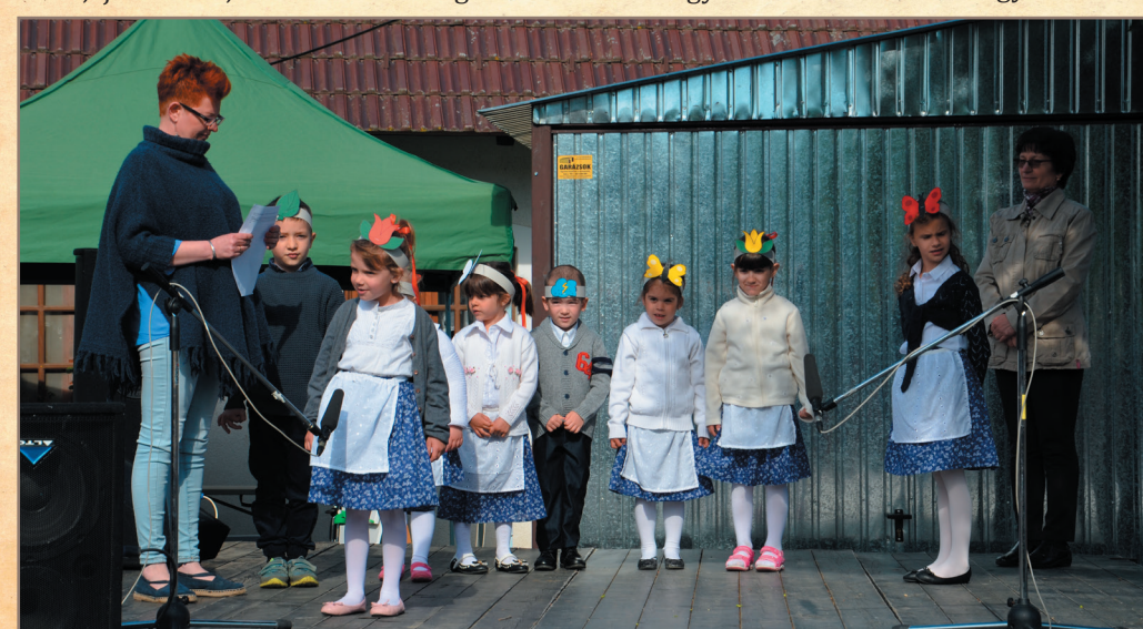
Fellépés az Értékek Ünnepe