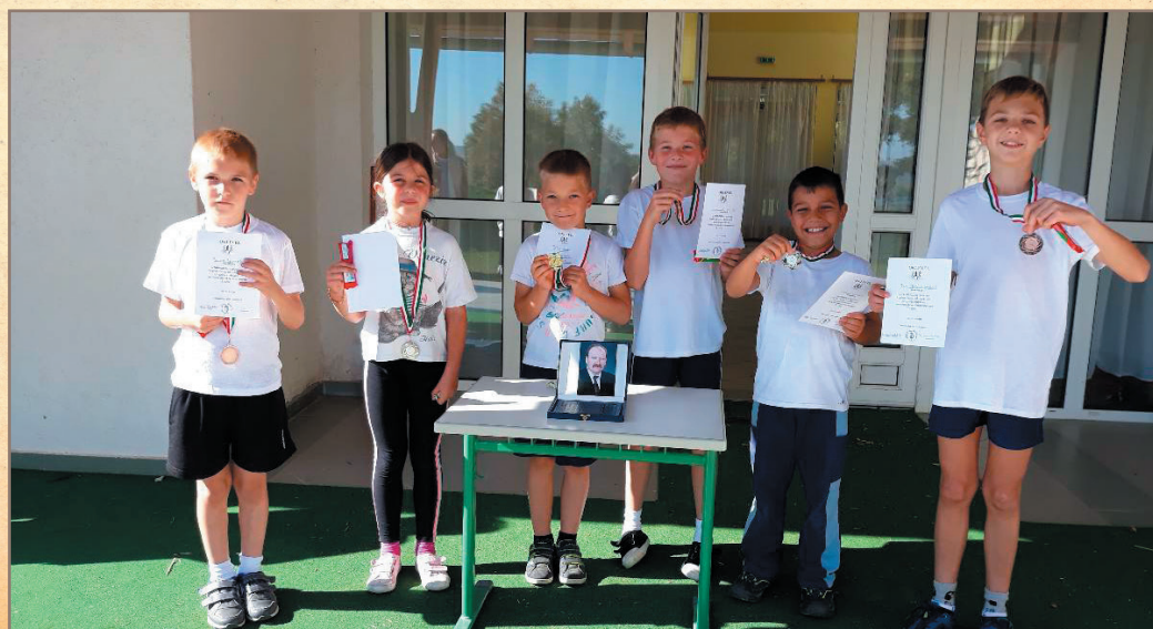
A futóverseny győztesei

osztályosok Balatonfüreden Diáksport Fesztiválon vettek részt, amelynek fő célja a teljesítménykényszer nélküli mozgás megismertetése és a különböző sportágak megszerettetése volt. Idén sem maradt el az Aradi vértanúk emléktúra a Baksa hegyen, amelynek keretében egy kis műsorral készültek a gyerekek. A mezzei futóverseny szintén el-