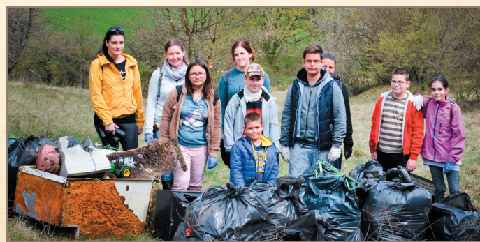
A Patakmeder tisztítás eredménye

igyekszünk elsősorban elérni. Abban bízunk, hogy felnőve ez a generáció megtalálja helyét a településen, és olyan kötődések alakulnak ki, amelyek segítenek nekik ebben. Idén a KincsesKlub-os alkalmak során a játék és szórakozás mellett kiemelten foglalkoztunk a kiskertünkkel, végigkövettük a folyamatot a magaszűrés elkészítésétől, az ültetésen, palántázáson keresztül a zöldségek éréséig, majd a legeslegnagyobb cukkínikból a legeslegfinomabb töcsit sütöttük meg egy nyári találkozásunk alkalmával. A kertészkedésben a helyi asszonyok is besegítettek, hogy több évtizedes tapasztalataikat átadják a gyerekeknek. Foglalkozásaink során igyekszünk játékos formá-