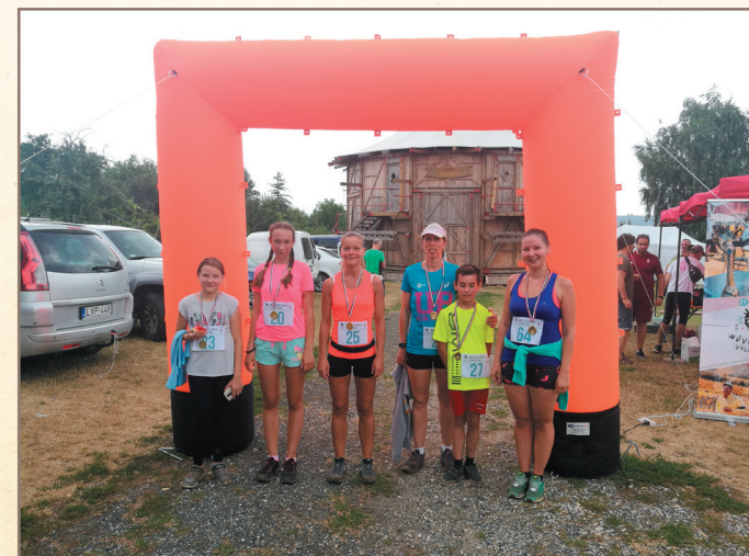
Művészetek Völgye futóverseny