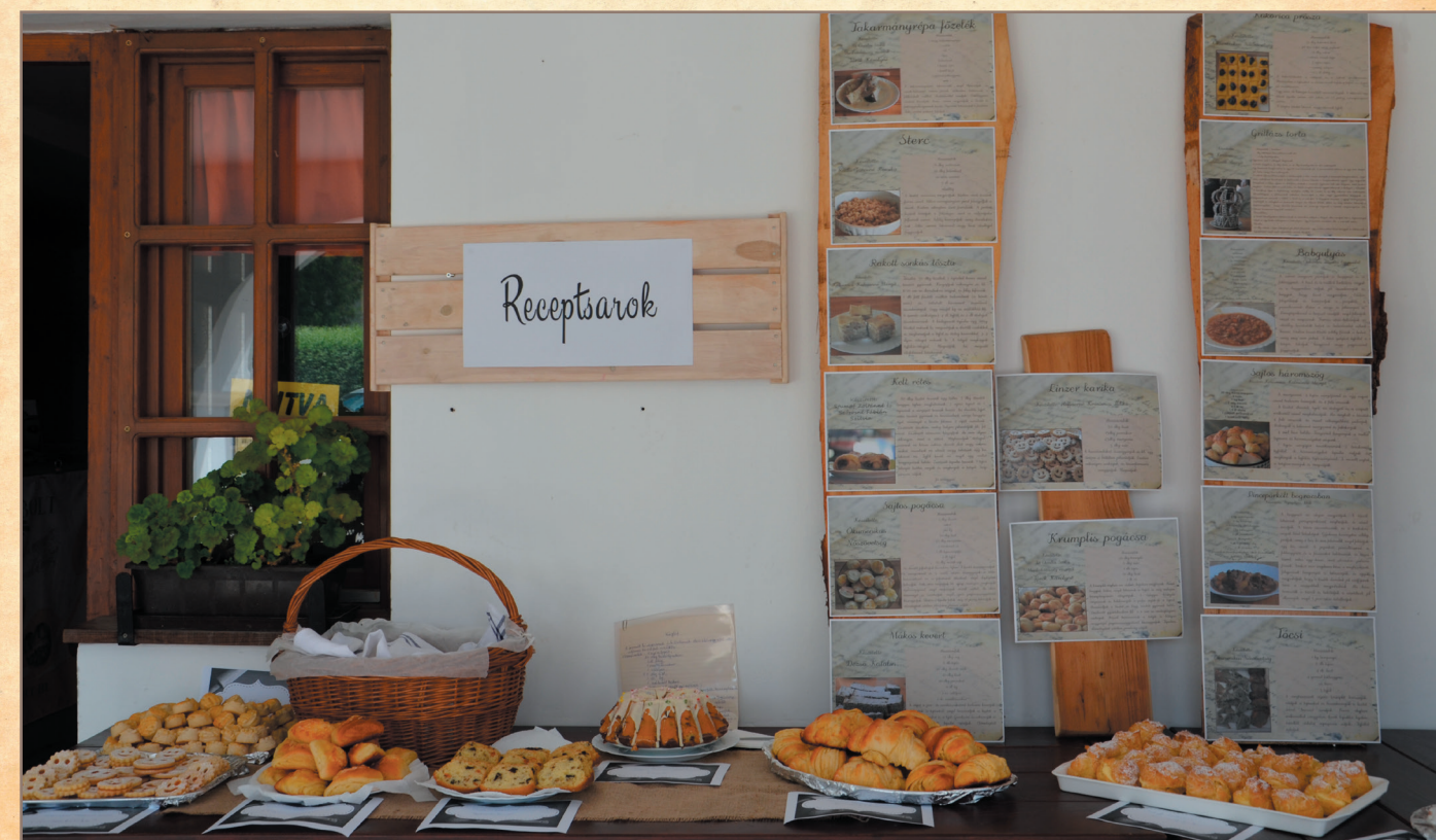
A dörögdi asszonyok főzőtudománya

A másik érték, amit idén felvettünk az értéktárba az A dörögdi asszonyok főzőtudománya , amit szerencsére nem csak otthon gyakorolnak, hanem minden eseményre, rendezvényre számíthatnak a szervezők arra, hogy egy kis sós vagy édes süteménnyel meglepik a vendégeket a helyi asszonyok. Az Értékek Ünnepeén a Receptsarok kialakításával és Szakácsműhely megszervezésével tudatosan gyűjtöttük a helyi recepteket és az elkészült finomságok fotóit, melyeket beszélgetésekkel kiegészítve a Dörögdi Ízek szakácskönyvben foglaltunk össze. Fontos számunkra, hogy ezek az ételek és a mögötte megbújó történetek ne vesszenek feledésbe.