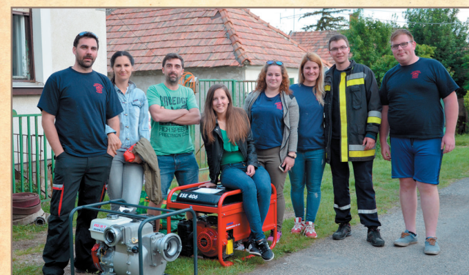
Forraltbor főző verseny

2019 a taliándörögdi önkéntes tűzoltók életében egy csendes évnek számított, de még így is volt miről beszámolniuk az év végéhez közeledve. A tavalyi évhez hasonlóan idén is minden hónap első vasárnapján találkozik a csapat, amikor többek között a felszereléseik karbantartásáról gondoskodnak és az aktuális feladatokat beszélnek meg.