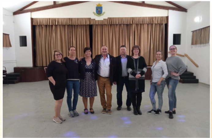
Szalontáncosok az utolsó tavaszi órán (Őszőlő lehet csatlakozni!)