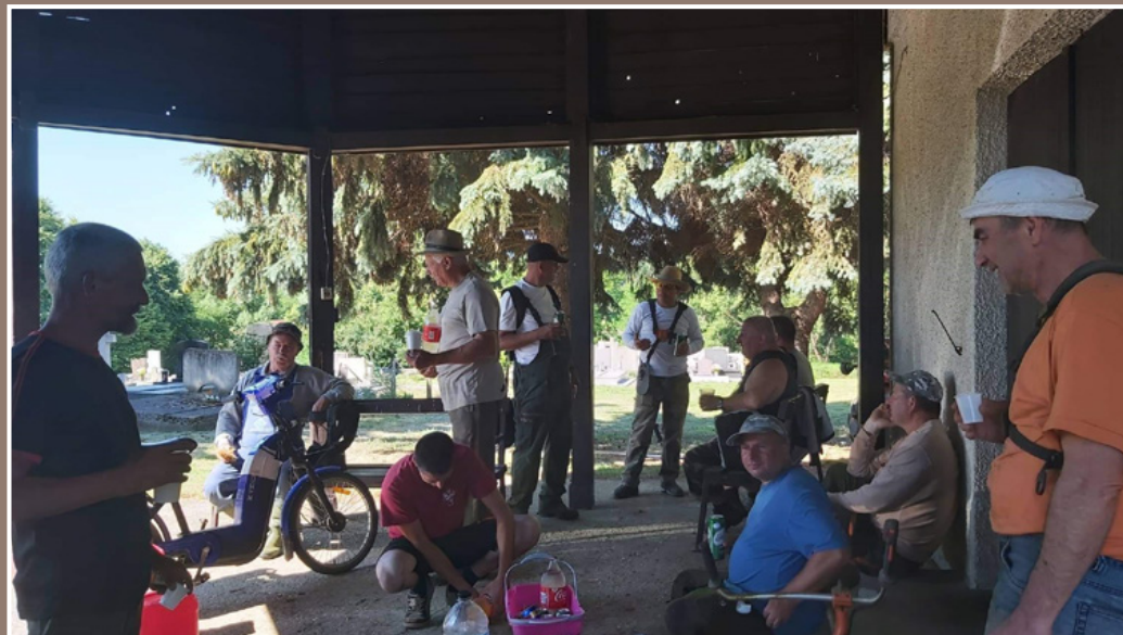
Temető kaszáló önkéntesek – köszönjük a munkájukat

Az év elején az Evangélikus Egyházzal közösen pályáztunk a temető fejlesztésére, melynek keretében a