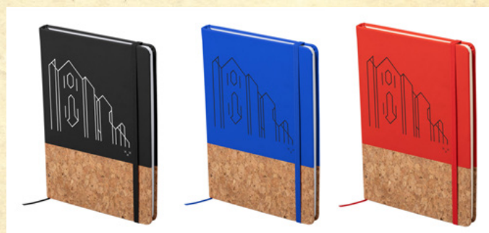
Új dörögdi termékek