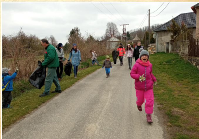
Egy maroknyi szemétszedő önkéntes

A rossz idő ellenére április 2-án egy kisebb lelkes csapattal szemétszedésre indultunk a falu környékén. 12 elvetemült, 24 db kesztyű segítségével 3 óra alatt 2 kereket, 2 vécécészt és 16 zsák szemetet szedett össze. Az akció után a KÖSZI-bázison egysültünk a környékbeli falvak önkénteseivel és kiolvasztottuk elgémberedett végtagjainkat egy jó forró paprikás krumpli és tea segítségével. →