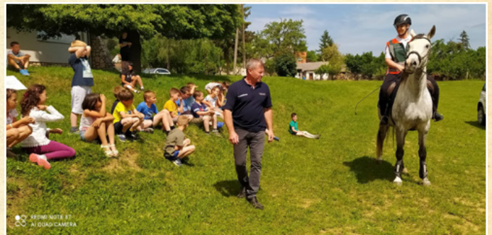
Közlekedési nap az iskolában