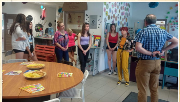
Látóúton a fiatalokkal egy budapesti ifjúsági közösségi térben

érdeklődés. Összesen 540 fő jelentkezett látóutakra közel 40 szervezetből, akik 22 Látópont címbirtokos szervezetet választottak azért, hogy újabb tapasztalatokat szerezzenek és szakmai kapcsolatokat építsenek.