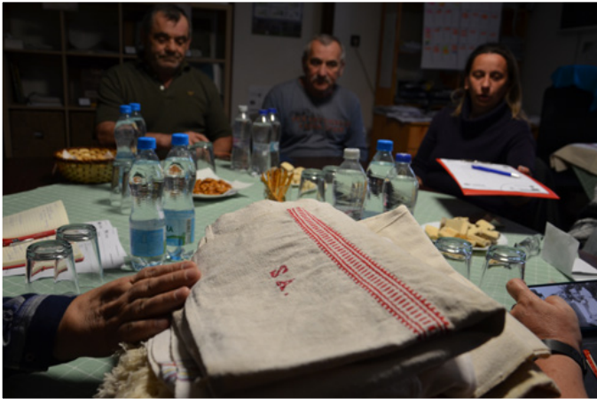
Okosodjunk együtt a Szabó családdal

beérkezett fényképekből állt össze. Ezúton is gratulálunk minden résztvevőnek, akik közül nem volt könnyű választani! A verseny díjazottjai jelen lapszám utolsó oldalán megtekinthetők.