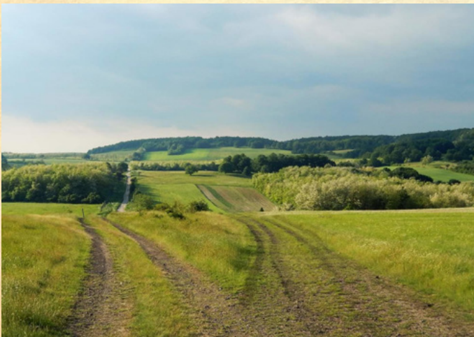
3. helyezett: Puha Orsolya