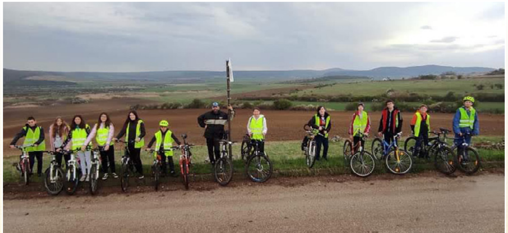
Bringatúrán a Kab-hegyen – KincsesKlub+

A „KincsesKlub+”-osokkal minden 2. hét péntekjének délutánját együtt töltjük a könyvtárban. Az idei alkalmak során jártunk téli fotózáson, Göntér Eszti segítségével elsajátítottuk a képszerkesztés alapjait, a farsangi időszakban fánkot sütöttünk, Nemesvámosra látogattunk az ottani értékörökhöz, közösen megtreveztük az évünket, készültünk a Taliándörögdi Értékek Ünnepeire, Herenden jártunk a Porcelánmanufaktúrában,