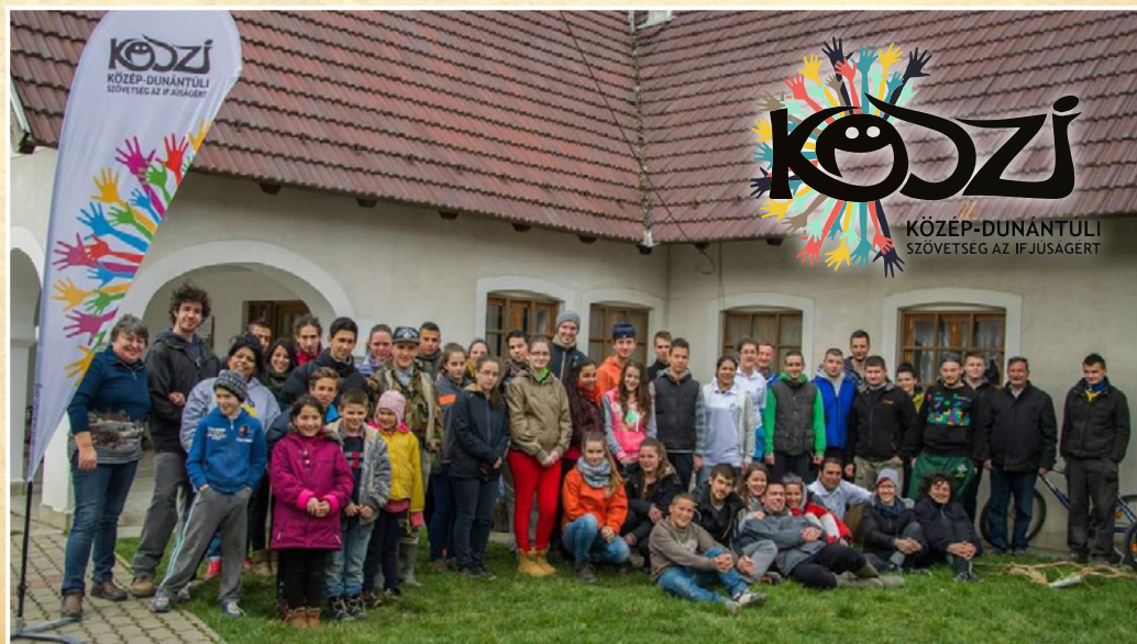
Köszí család ☺

A Közép-dunántúli Szövetség az Ifjúságért szervezet (KÖSZI) országsszerte elismert, Taliándörögdi és a térség fiataljaiért végzett közösségfejlesztő és szemléletformáló tevékenysége a mai naptól fogva kiemelt részét képezi a Taliándörögdi Helyi Értéktárnak.