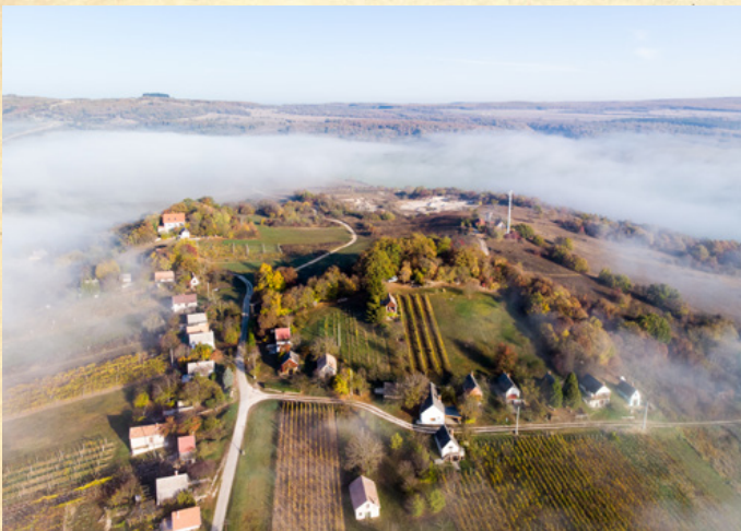
2. helyezett: Füle Tamás