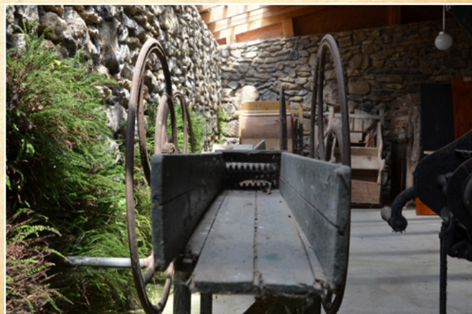
Mezőgazdasági gépek és tárgyak kiállítása