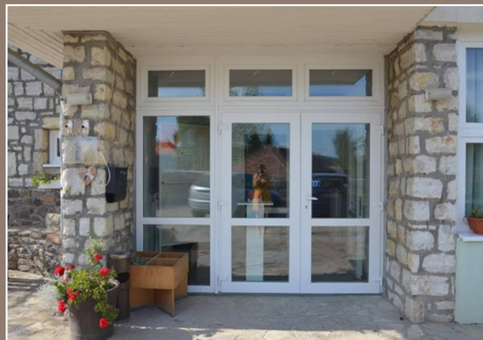
A nyílászárócseré eredménye

A Művészetek Völgye fesztivál idén is megszervezésre kerül július 22-31. között, a megszokott helyszínekben kis változás lépett fel, mégpedig az óvodaudvar és a sportpálya esetében, melyek ez alkalommal kimaradnak a fesztivál helyszínek közül. A lakosok számára a belépés idén is ingyenes lesz a lakcímkártya bemutatásával.