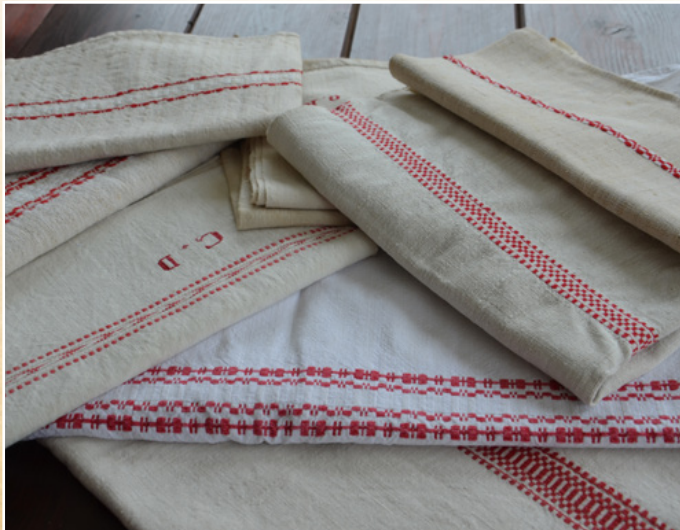
Szabó Antal hagyatéka