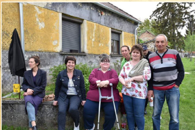
VI. Taliándörögdí Értékek Ünnepe

A szakkörökben, műhelyekben tevékenykedő ak-