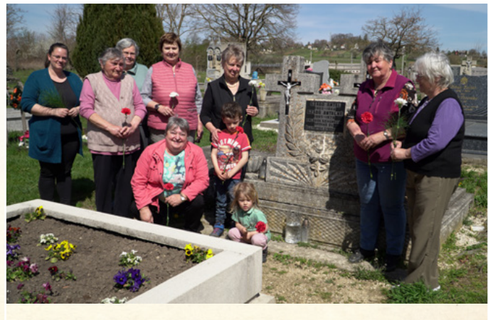
Taliándörögdi Hímzőműhely a mester sírjánál