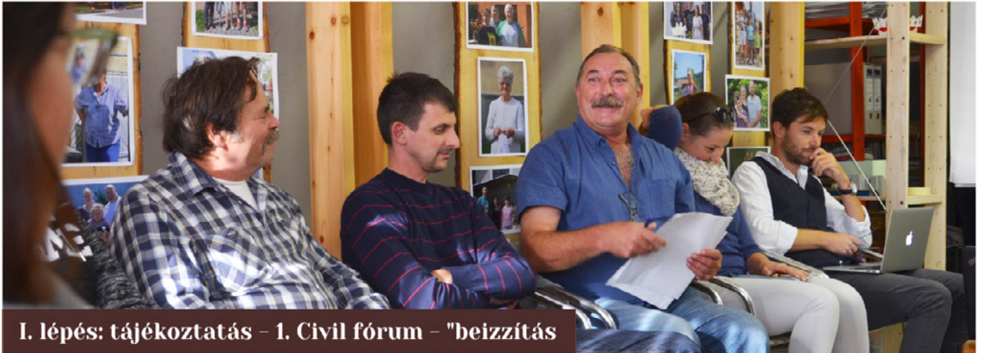
I. lépés: tájékoztatás – 1. Civil fórum – "beizzítás"