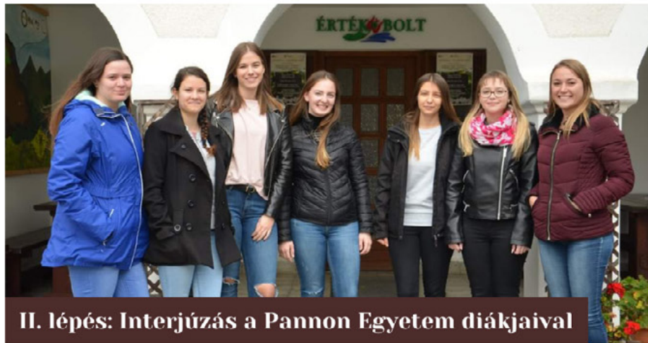
II. lépés: Interjúzás a Pannon Egyetem diákjaival