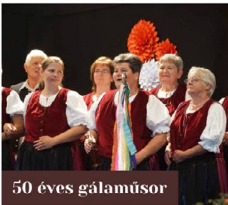
50 éves gálaműsor