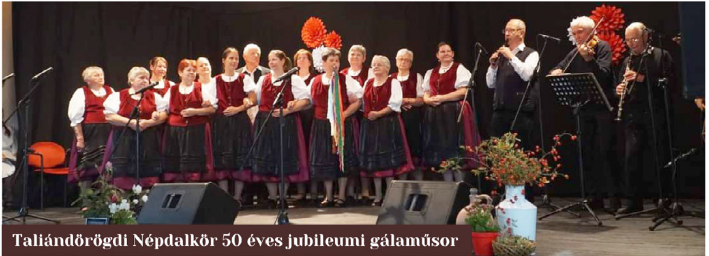
Taliándörögdi Népdalkör 50 éves jubileumi gálaműsor