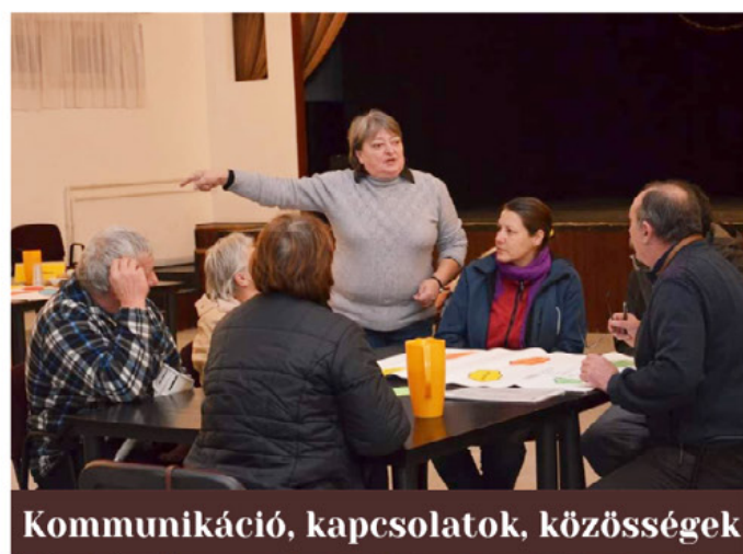
Kommunikáció, kapcsolatok, közösségek