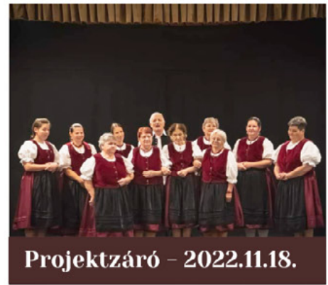
Projektzáró – 2022.11.18.