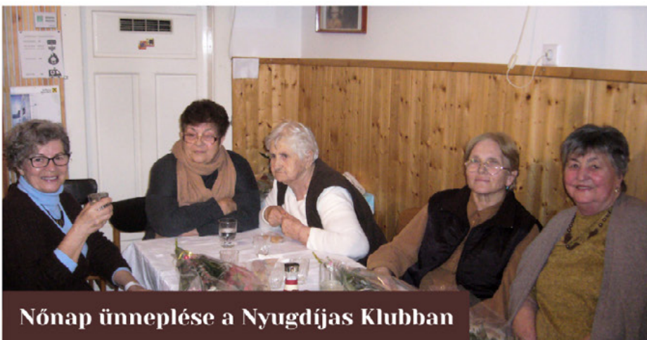
Nőnap ünneplése a Nyugdíjas Klubban