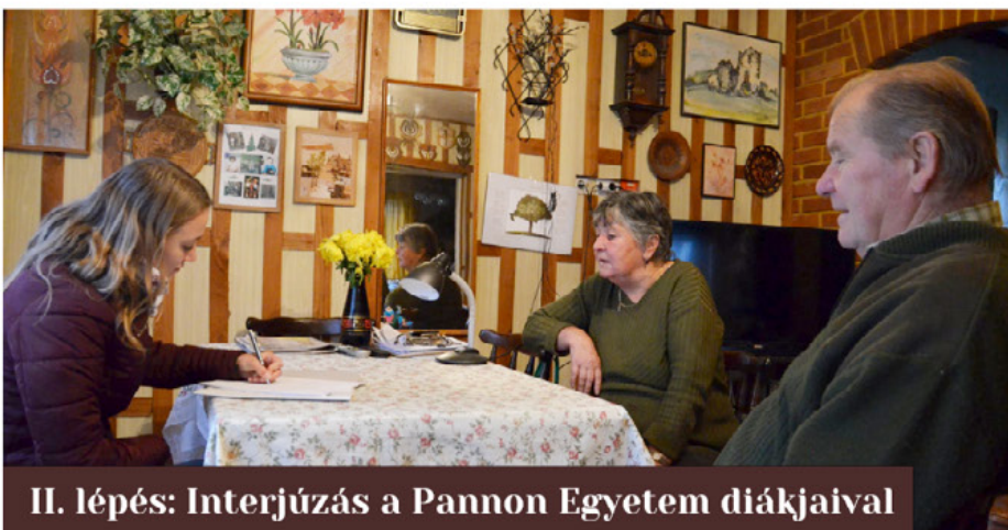
II. lépés: Interjúzás a Pannon Egyetem diákjaival