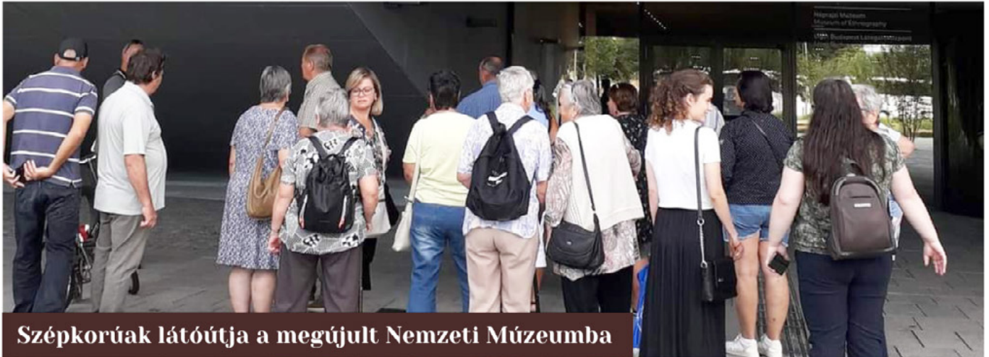
Szépkorúak látóútja a megújult Nemzeti Múzeumba