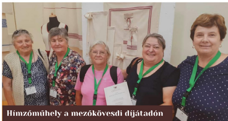
Hímzőműhely a mezőkövesdi díjátadón