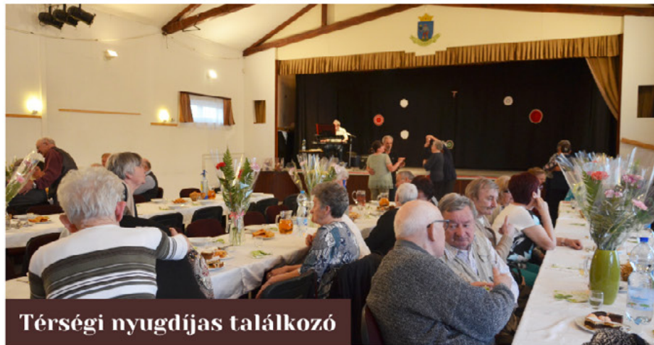
Térségi nyugdíjas találkozó