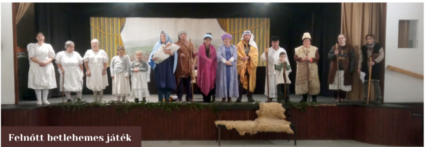
Felnőtt betlehemes játék