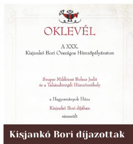
Kisjankó Bori díjazottak