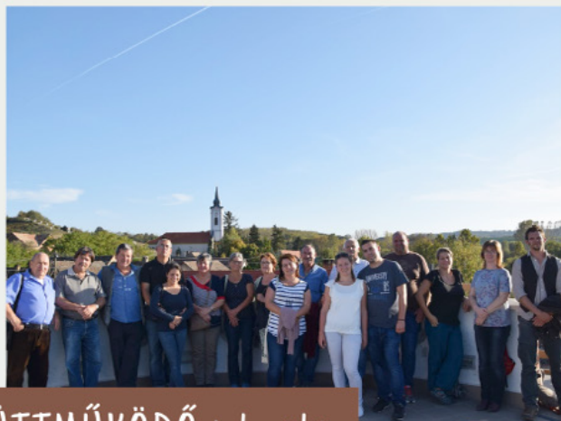
Taliándörög az EGYÜTTMŰKÖDŐ település