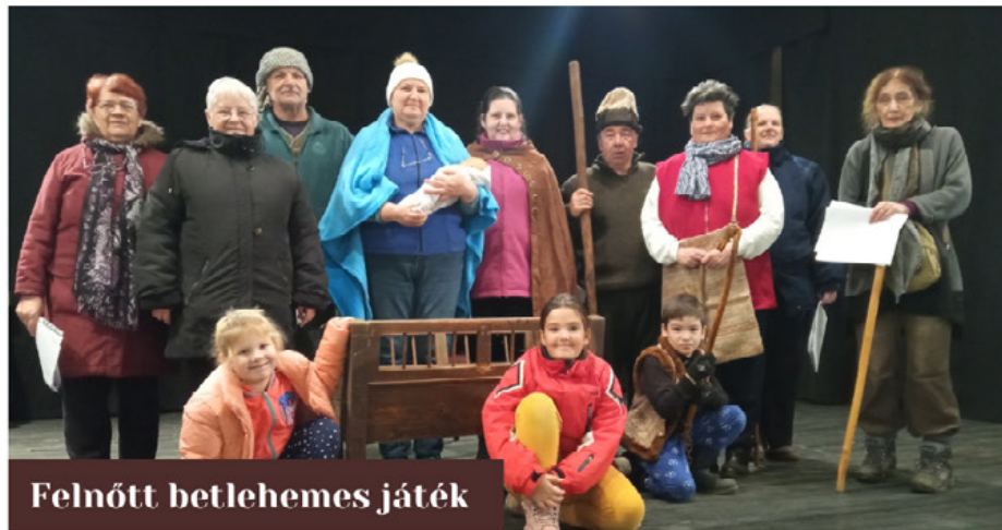
Felnőtt betlehemes játék